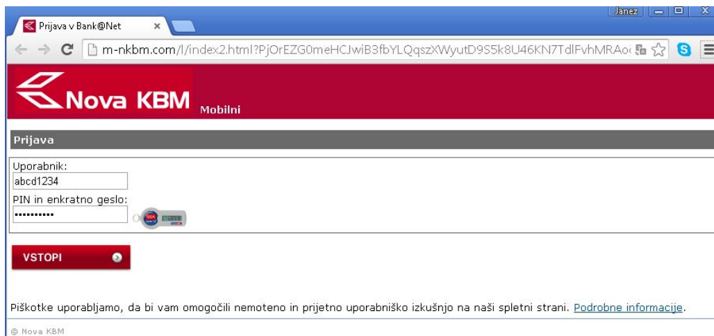
Slika 3: Prikaz lažne vstopne spletne stani v brskalniku