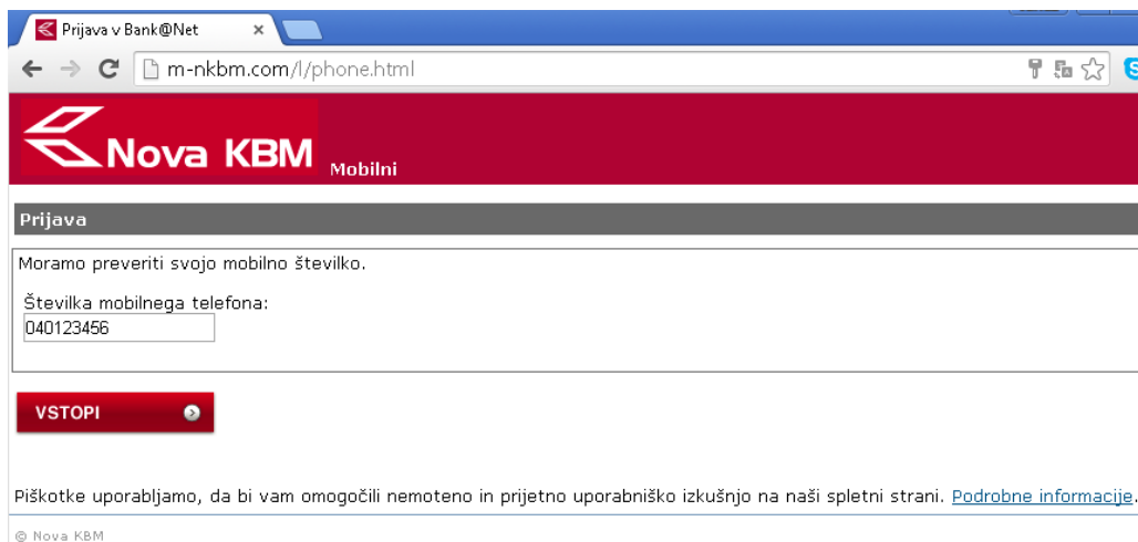
Slika 4: Prikaz lažne strani za vpis telefonske številke