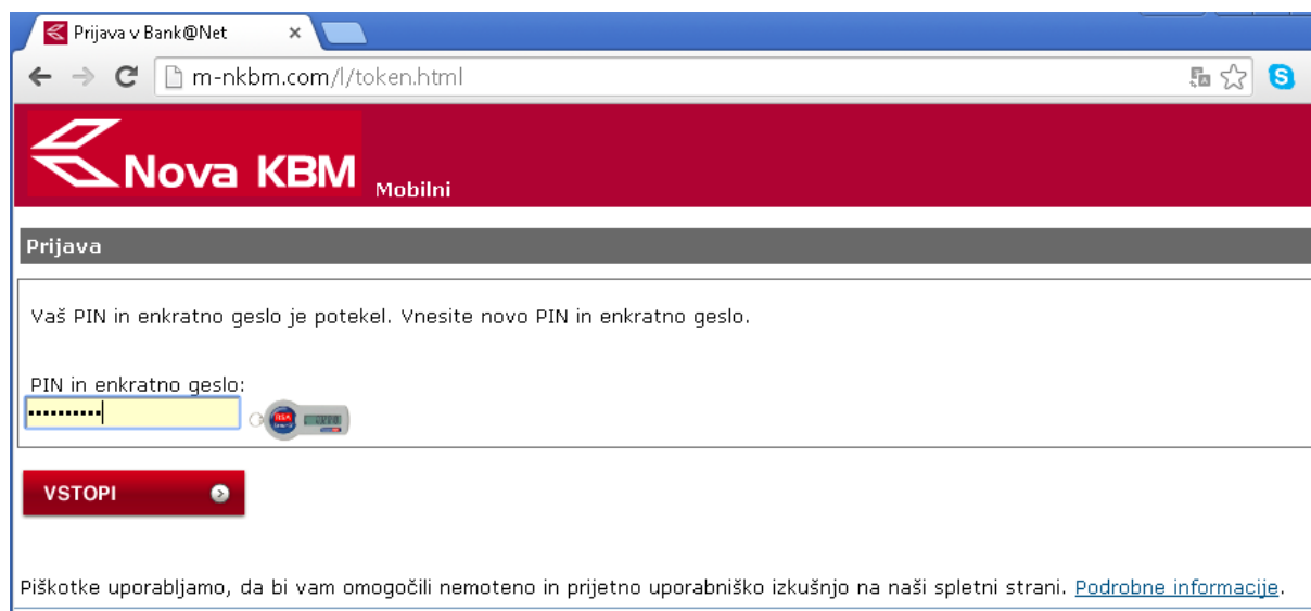
Slika 5: Poziv k ponovnemu vpisu PIN in enkratnega gesla.