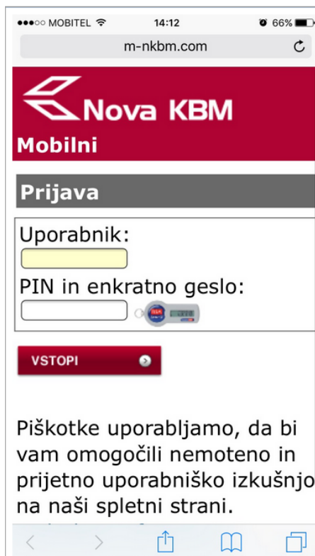
Slika 2: Prikaz lažne vstopne spletne strani na mobilnem telefonu

KORAK 2: Klik na ponujeno povezavo vas pripelje na lažno spletno stran: